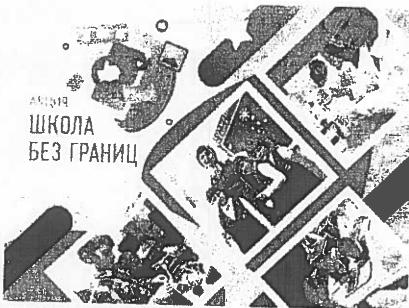
4. Баннер (1000*1000 px):